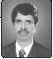
ಎಫೆಸ್, ದರೈ, ಪುತ್ತೂರ್.

ಅಂಕ್ವಾರ್ ಮರಿಯೆಚ್ಯಾ ಜಲ್ಮಾಚೆಂ ಫೆಸ್ತ್ ಸಪ್ತೆಂಬರ್ 8 ತಾರ್ಕೆರ್ ಯೆತಾ. ತ್ಯಾ ದಿಸಾ ಇಗರ್ಜ್ ಮಾತಾ ಮರಿಯೆಚೊ ಜಲ್ಮಾ ದೀಸ್ ಆಚರಣ್ ಕರಿತ್ ಆಯ್ಲ್ಯಾ ಪುಣ್ ಮಂಗ್ಳುರಿ ಕ್ರಿಸ್ತಾಂವ್, ಹೊ ದೀಸ್ ಮೊಂತಿ ಸಾಯ್ವಿಣಿಚೆಂ ಫೆಸ್ತ್ ಮ್ಹಣ್ ಆಚರಣ್ ಕರ್ನ್ ಯೆತಾ.