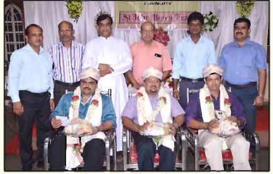
ಯುವ ಉದ್ಯಮಿಂಕ್ ಸನ್ಮಾನ್