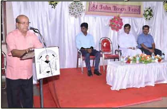
ಮುಕೆಲ್ ಸಯ್ರಾಚೆ ಭಾಶಣ್