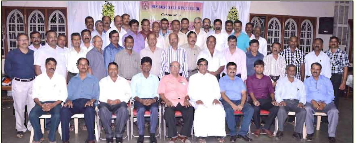
ಡೊನ್ ಬೊಸ್ಕೊ ಕುಟ್ಮಾ