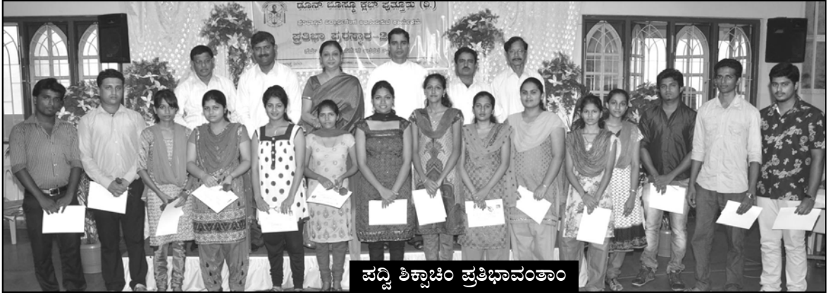
ಪದ್ಮ ಶಿಕ್ಷಾಚಿಂ ಪ್ರತಿಭಾವಂತಾಂ

ಕ್ರಾಸ್ತಾನ್, ಡೊನ್ ಬೊಸ್ಕೊ ಕ್ಲಬ್ಬಾನ್, ಕರ್ಲ್ಯಾ ಹ್ಯಾ ವಾವ್ರಾ ಖಾತಿರ್ ಶಾಬಾಸ್ಕಿ ಪಾಟಯ್ಲಿ. “ಧೊಡ್ಯಾಚ್ ವರಾಂನಿ ಆಪ್ಲ್ಯಾ ಸ್ಥಾಪನೆಚೊ ಬಾಂಗಾರೋತ್ಸವ್ ಸಂಬ್ರಮ್ಚ್ಯಾ ಡೊನ್ ಬೊಸ್ಕೊ ಕ್ಲಬ್ಬಾಕ್ ಸರ್ವ್ ಬರೆಂ ಮಾಗ್ತಾಂ” ತೊ ಘುಣಾಲೊ.