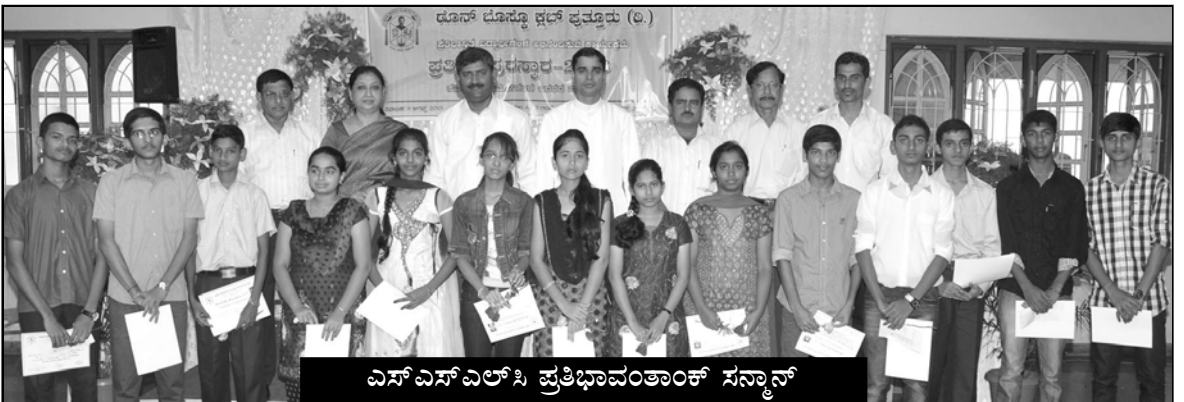
ಎಸ್‌ಎಸ್‌ಎಲ್‌ಸಿ ಪ್ರತಿಭಾವಂತಾಂಕ್ ಸನ್ಮಾನ್