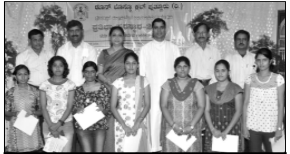
ಪಿಯುಸಿ ಶಿಕ್ವಾಚಿಂ ಪ್ರತಿಭಾವಂತಾಂ