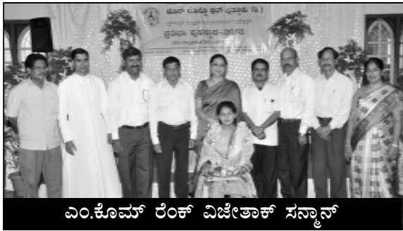
ಎಂ.ಕೊಮ್ ರೆಂಕ್ ವಿಜೇತಾಕ್ ಸನ್ಮಾನ್