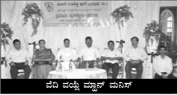
ವೆದಿ ವೆಂಪ್ಲಿ ಮ್ಹಾನ್ ಮನಿಸ್