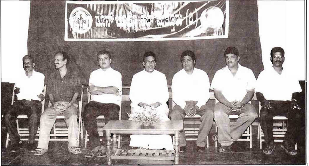
2008-'09 ವರ್ಯಾಚೆ ಹುದ್ದೆದಾರ್

ಡೊನ್ ಯೊಸೆಫ್ ಕ್ಲೆವ್ವಾಜೆ ಸಾಂದೆ ಅನಿ ತಾಂಚ್ಯಾ ಕುಟ್ಮಾದಾಂಚೆಂ ಸಹಿಮಿಲನ್ (18-04-09)